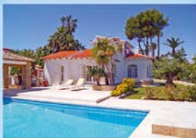
La Xara Denia, Villa, 3 SZ, 2 BZ, Garage, Heizung, Klima, 395.000 €