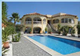
Denia, Villa, 3 SZ, 3 BZ, Aufzug, Garten, ZH, Klima, 599.000 €