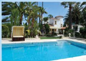
Denia, Villa, Meersicht, 4 SZ, 3 BZ, Heizung, Klima, 475.000 €