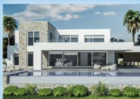
Denia, Bauprojekt, Meerblick, 5 SZ, 4 BZ, Pool, Klima, 1.385.000 €