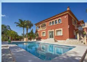
Denia, Villa, großes Grundstück, 5 SZ, 4 BZ, Heizung, Klima, 870.000 €