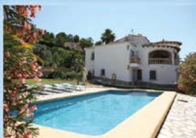
Denia, Villa mit Gästewohnung, 4 SZ, 4 BZ, Heizung, Klima, 479.000 €