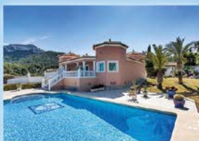
Denia, Villa mit Meerblick, 3 SZ, 2 BZ, Heizung, 625.000 €