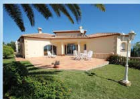
Denia, Luxusvilla, Meersicht, 4 SZ, 4 BZ, Klima, Heizung, 1.490.000 €

Wir suchen Objekte in Denia, Javea, Moraira, Oliva, Pego, Els Poblets, La Sella, Orba, Lliber, Benidoleig, etc.